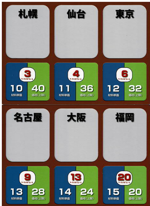
戦略MGマネジメントゲーム 製造業版 リスクカード一覧

マーケット盤写し・リスクカード一覧 カメラ越しでは文字が見えにくいので各プレイヤーの手 許に用意しておく。