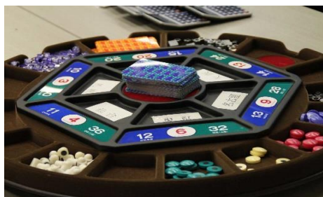
（ 戦略MGマネジメントゲーム盤 ）